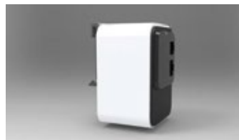
WL-API3150-040 - DIN SIDE VIEW - DIN RAIL MOUNTING