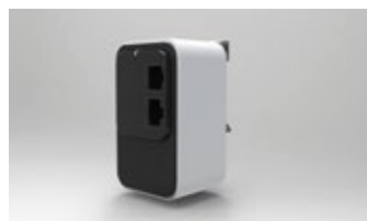
WL-API3150-040 - DIN FRONT - DIN RAIL MOUNTING