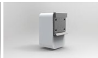
WL-API3150-040 - DIN BACK - DIN RAIL MOUNTING