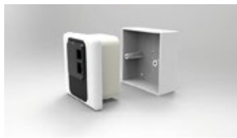
EU - WALL SINGLE GANG