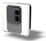
WL-API3150-040 (EU) - 86x86