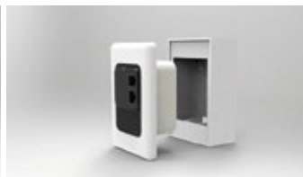
USA - SEINGLE WALL GANG