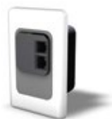
WL-API3150-040 (US) - 120x75