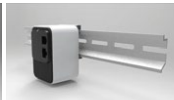
DIN RAIL INSTALLATION